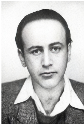
Paul Celan (1938)