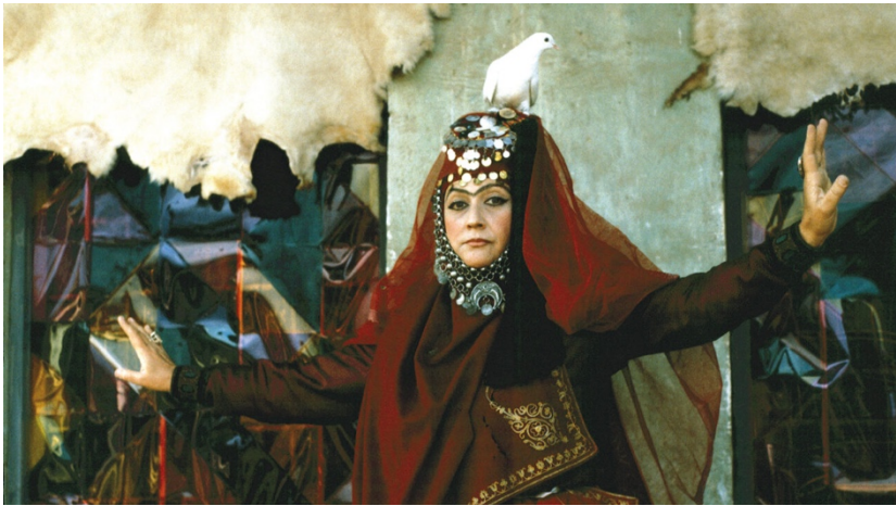
Filmstill aus Ashik Kerib