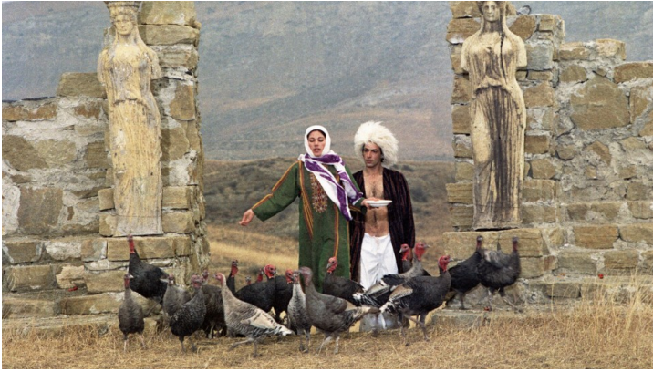
Filmstill aus The Legend of Suram Fortress