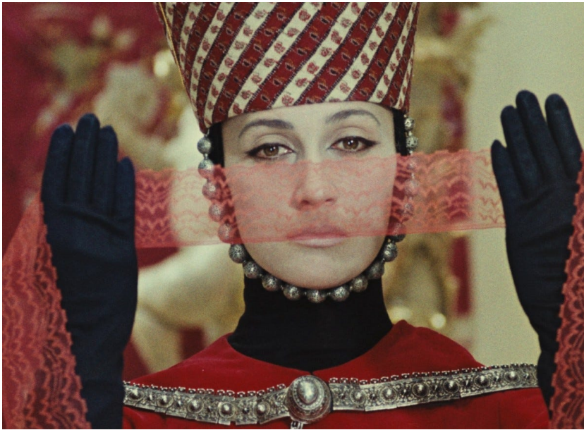
Filmstill aus Die Farbe des Granatapfels