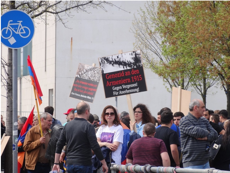
Demonstration „Genozid 1915 - Initiative Deutschland“ in Berlin am 25.04.2015